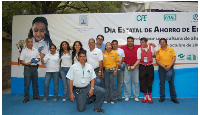
Coordinadores de talleres de la Expo Ahorro Infantil